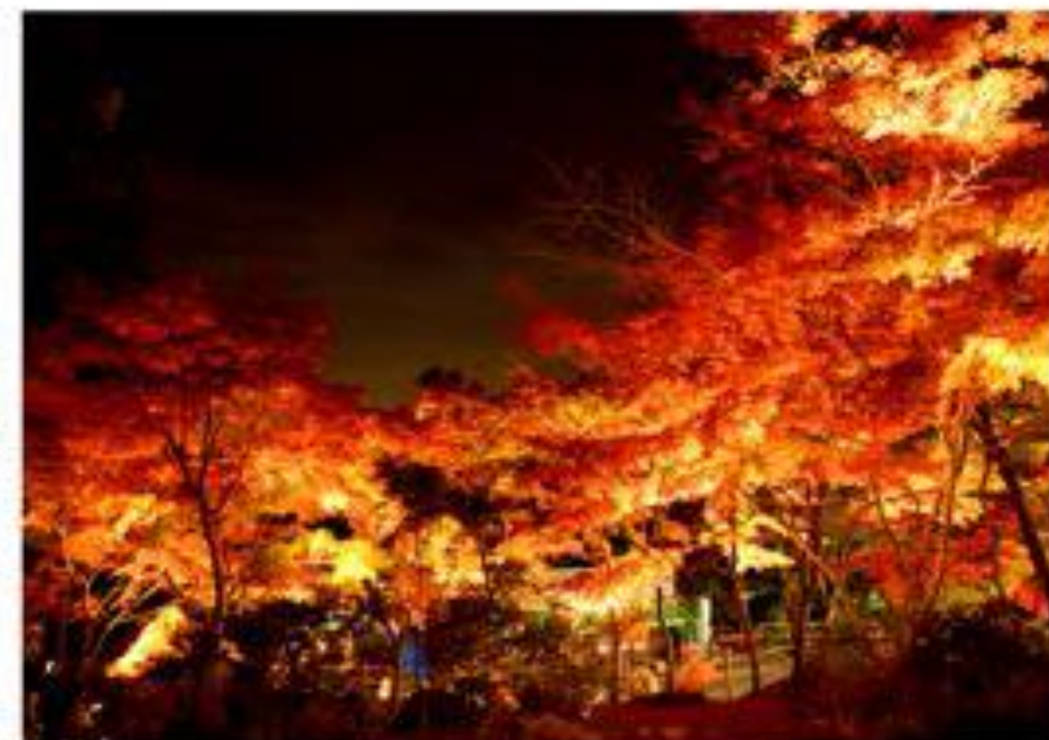
為路面纜車宮脇站附近增添色彩將近100棵的紅葉夜間點燈