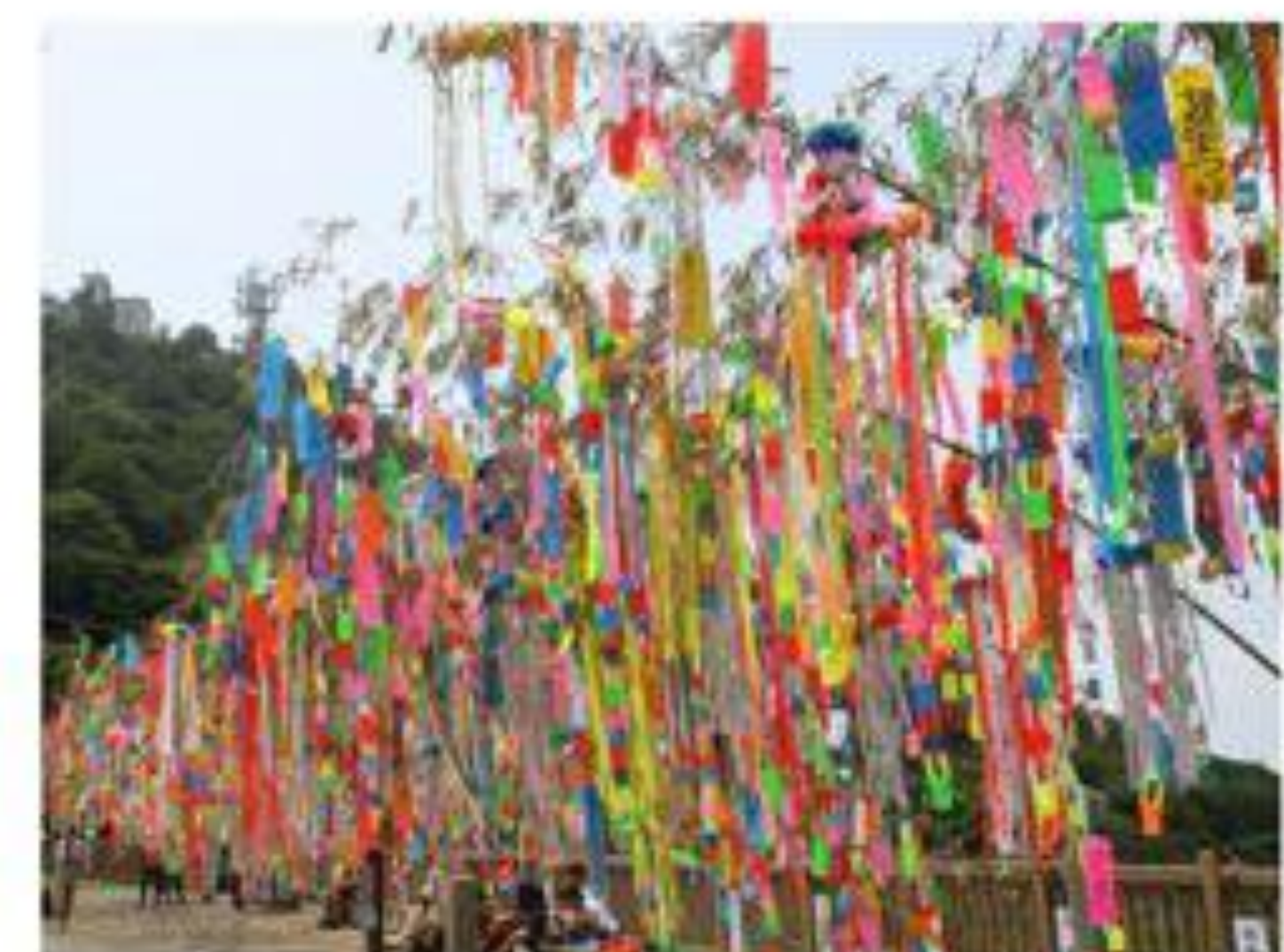
夏天(7月下旬)七夕裝飾隨著筑波夏風飄揚