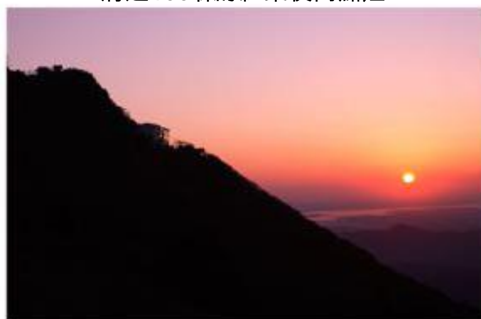
從筑波山頂看到的元旦日出上午6點44分左右