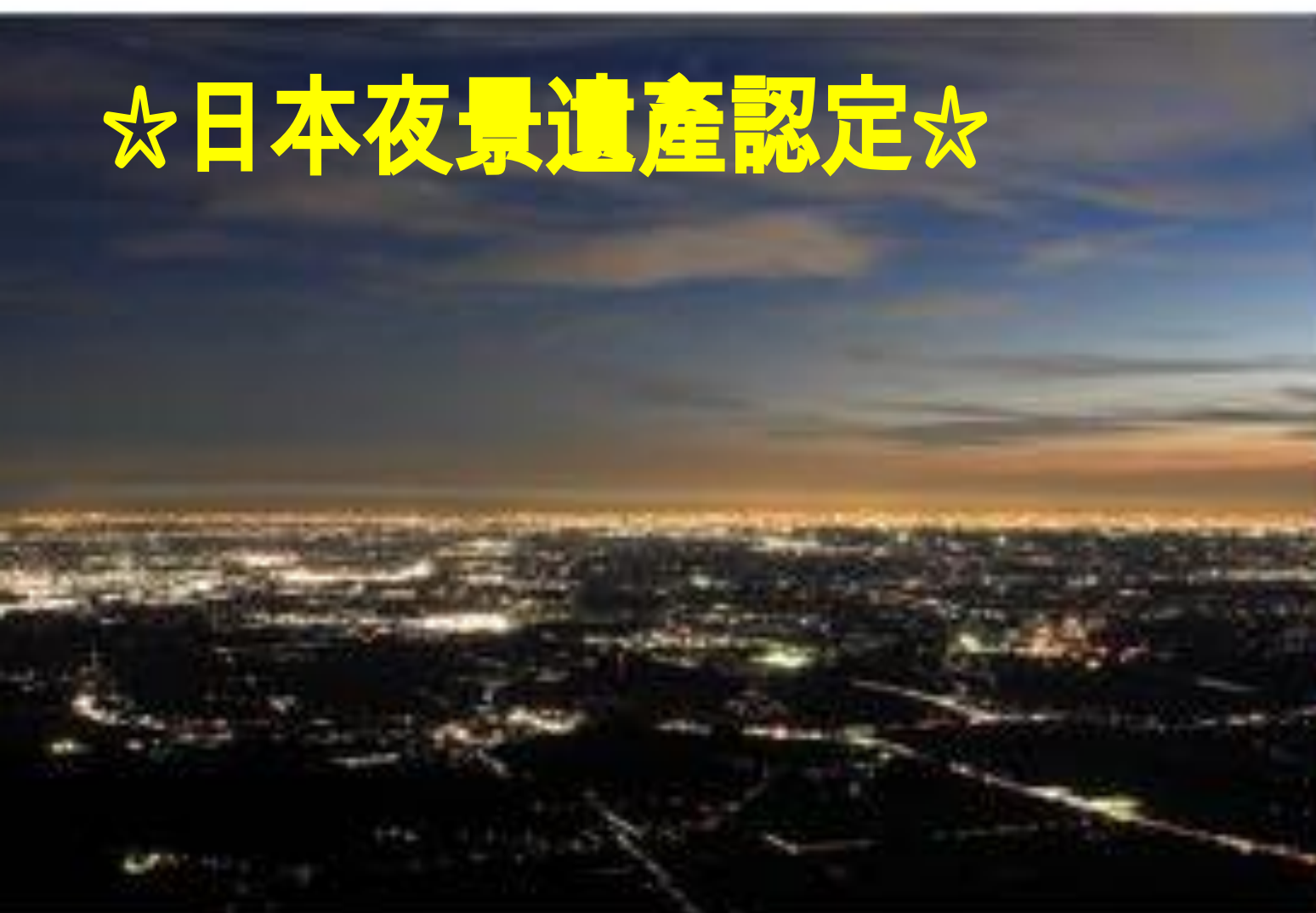
從空中纜車上看到的關東平原夜景在寂靜中閃耀著的陸上星光